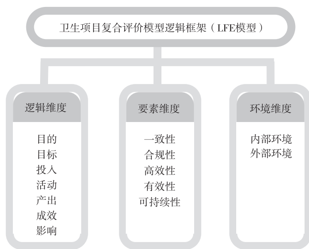
图1 卫生项目复合评价模型逻辑框架图(LFE 模型)

卫生项目复合评价模型逻辑框架是在世界银行提出的“结果链”基础上,结合中国实际,对评价要素进行补充调整,并强化对环境影响因素的分析。卫生项目复合评价模型逻辑框架主要由逻辑维度(Logic)、要素维度(Factor)和环境维度(Environment)三个维度构成(简称:LFE 卫生项目评价模型)(图1)。