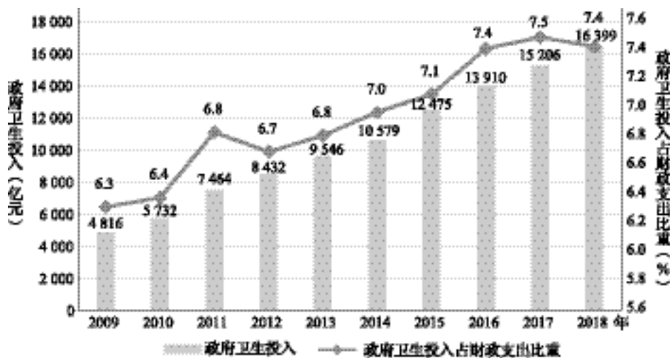
图 3 我国政府卫生投入变化

注:数据来源于国家卫生健康委卫生发展研究中心(以下简称卫生发展中心)《中国卫生总费用报告》